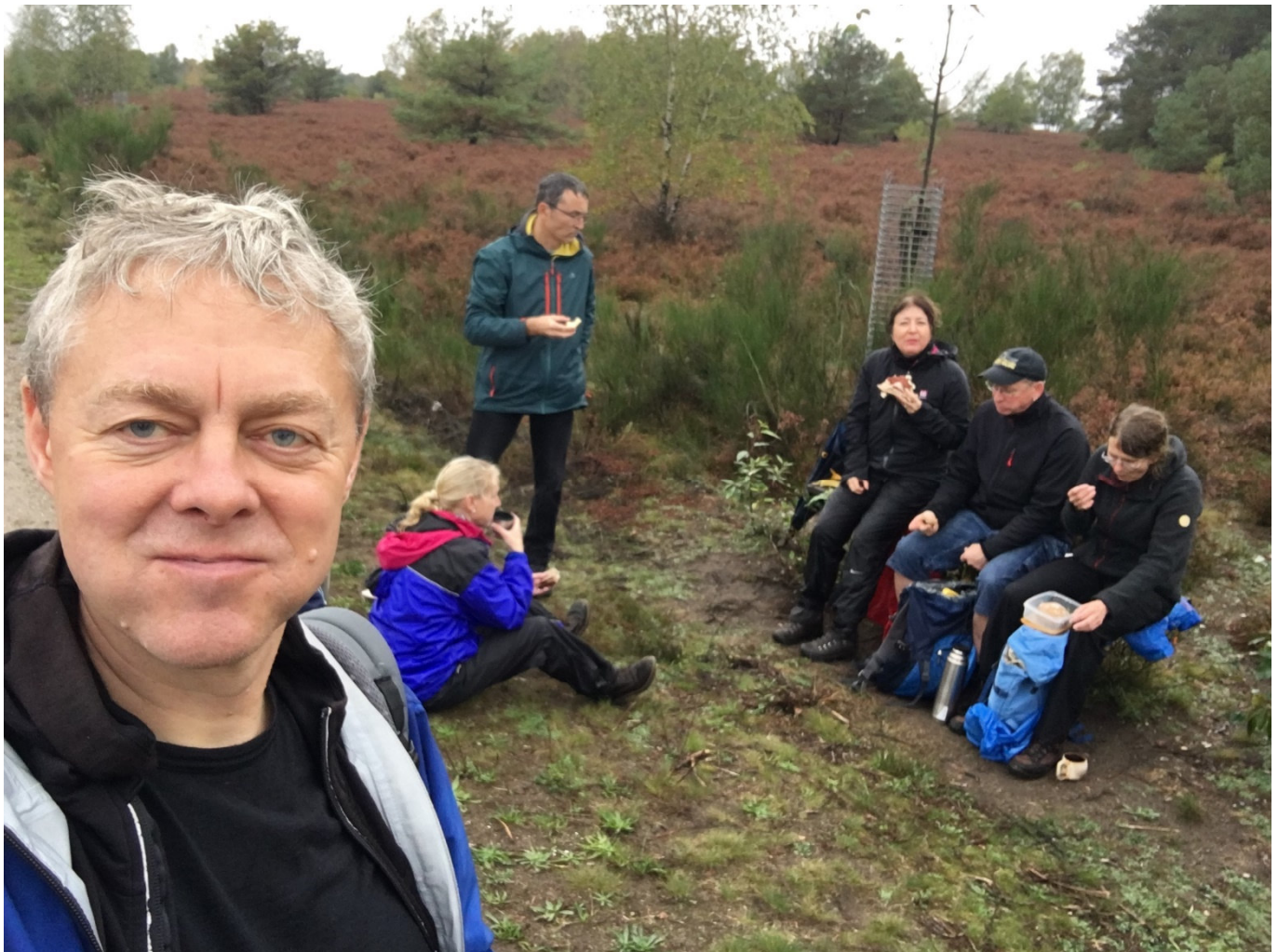
Das Foto zeigt die Teilnehmer der 5. Kensho-Wander-Tour vom 29.09.2019 während einer Regenpause